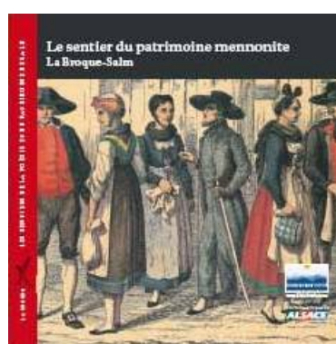
Disponible en français et en allemand