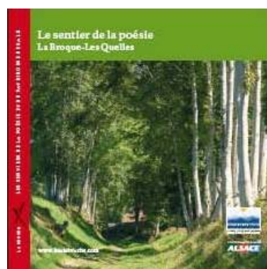
Disponible en français et en allemand

Cliquez sur les couvertures ci-dessous pour découvrir les sentiers.